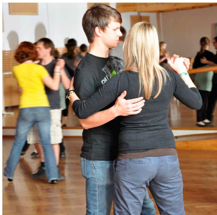
Volle Konzentration: Nach dem Trockentraining (einzeln und zu zweit) wurde das Erlernete mit Musik umgesetzt.